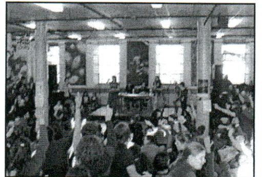
Prise de position