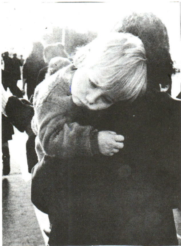
Les enfants se meurent...

Merci de votre collaboration A.E.L.C.S.L.