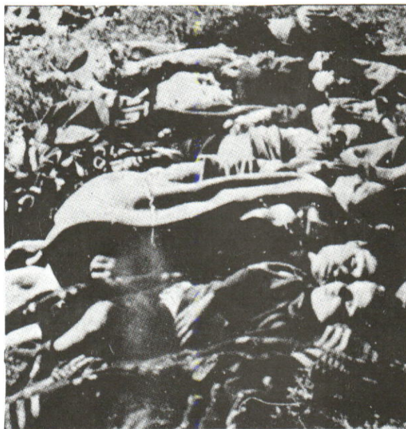
Les massacres se poursuivent....